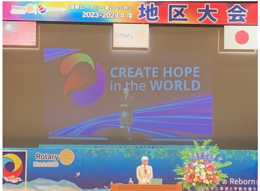
5/18 (土) RI 第 2720 地区 2023-24 地区大会 in 日田。ご参加の皆さま、お疲れさまでした！