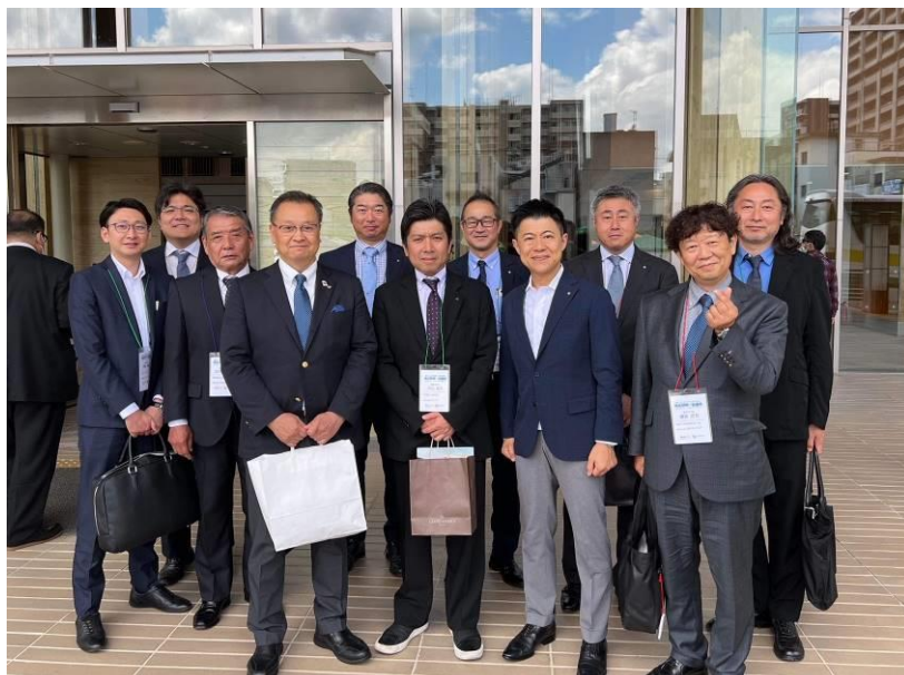
5/14 (日) 2023-24 地区研修協議会 in 日田。ご参加の皆さん、お疲れさまでした！