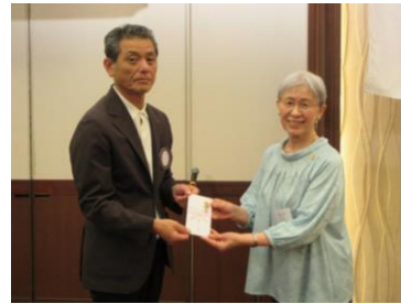
「とっておきの音楽祭」支援金贈呈

皆さま、こんにちは。社会奉仕委員会より、5/21 (日) 「オハイエくまもと 第14回とっておきの音楽祭」のご案内です。多数のご参加をお待ちしております。