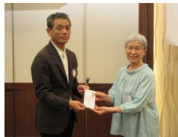
「とっておきの音楽祭」支援金贈呈

皆さま、こんにちは。社会奉仕委員会より、5/21 (日)「オハイエくまもと 第14回とっておきの音楽祭」のご案内です。多数のご参加をお待ちしております。