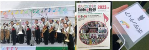
オハイオ熊本2022 ボランティア活動