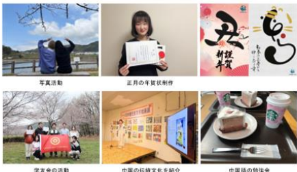
写真活動 正月の年賀状制作 学友会の活動 中国の伝統文化を紹介 中国語の勉強会