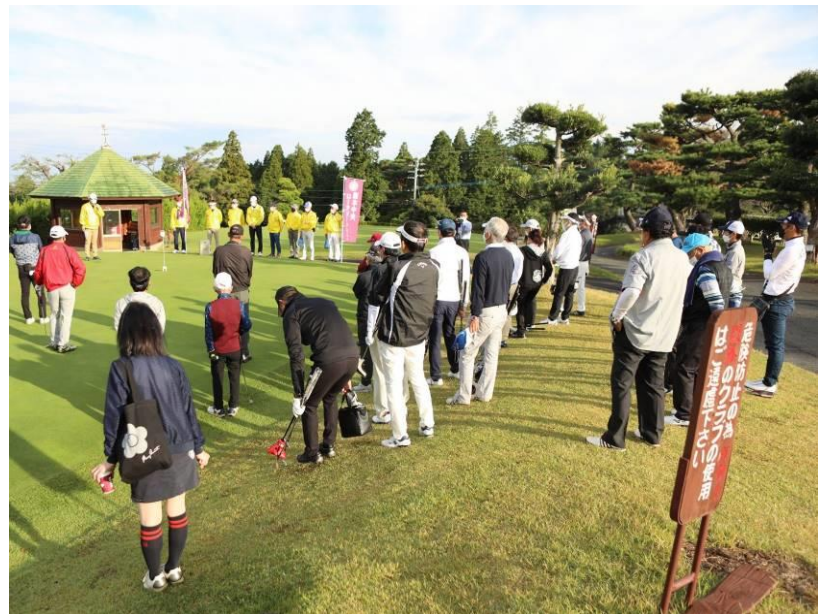
10/22 (金) 熊本中央 RC チャリティコンペより。ご参加の皆さん、お疲れさまでした！

例会日：毎週月曜日 12：30～13：30 例会場：〒860-8535 熊本市中央区上通町 2-1 ホテル日航熊本内 創立日：昭和 33 年 9 月 1 日（承認昭和 33 年 11 月 24 日） 会長：玉田光識 / 幹事 馬場大介 / クラブ広報委員長 / 大津英敬