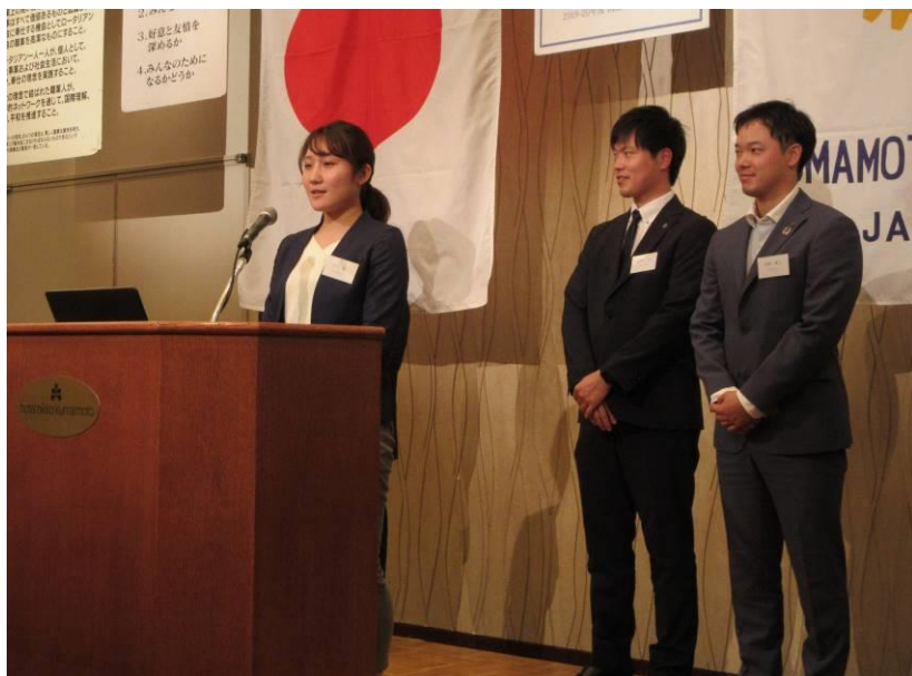
熊本南 RAC 会員の皆さん、今年度の活動報告お疲れさまでした！