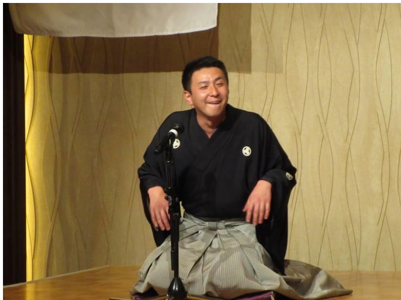
本日の卓話 落語家 桂竹紋様、楽しい時間をありがとうございました！