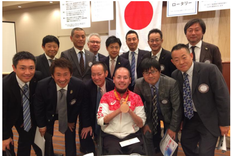
ウィルチェアーラグビー (リオパラリンピック銅メダリスト) 乗松聖矢選手にお越しいただきました!