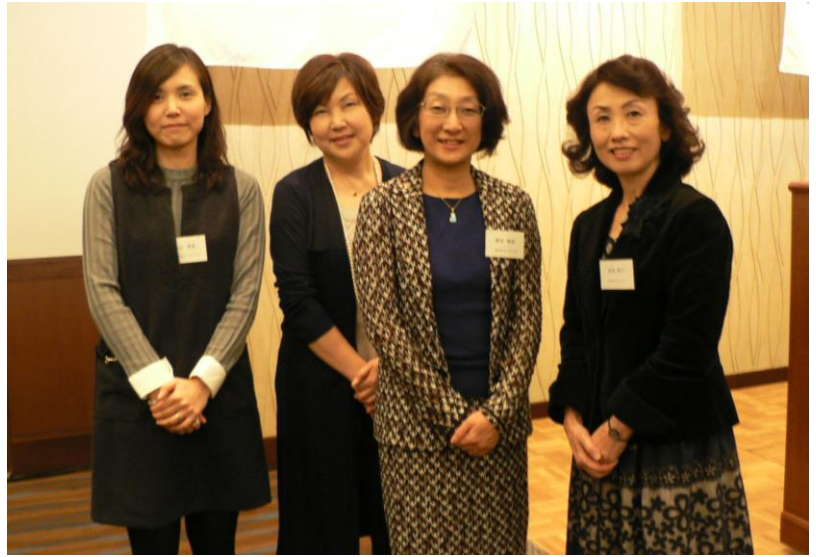
夫人の会の皆さま、ご来訪ありがとうございました！

さて、11/14 (土) 熊本第4グループの IM が開催されました。当クラブからは20名のご参加をいただきました。