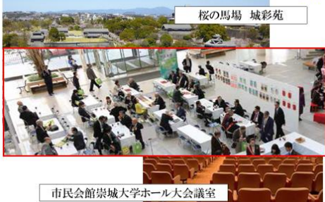
■友愛の広場(案) 3月26日(土)のみ Rotary