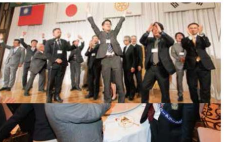
■RI会長代理歓迎晩餐会・会員希望交流会(案) Rotary