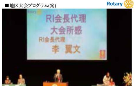
■地区大会プログラム(案) Rotary