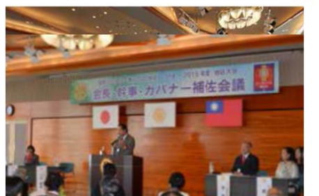
■会長・幹事・ガバナー補佐会議(案) Rotary