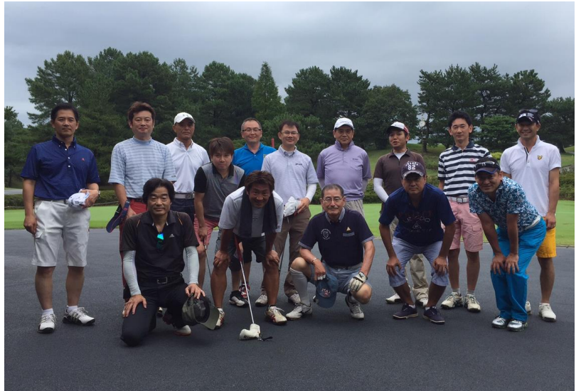
8/19(水) 2015-16(後藤年度) ゴルフコンペ in あつまるレークカントリークラブ