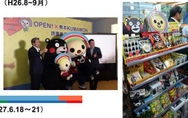
2015 新・日本旅遊節 (H27.6.18～21)