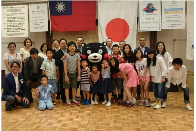
台北大同扶輪社 短期青少年交換留学生の皆様、ようこそいらっしゃいました！