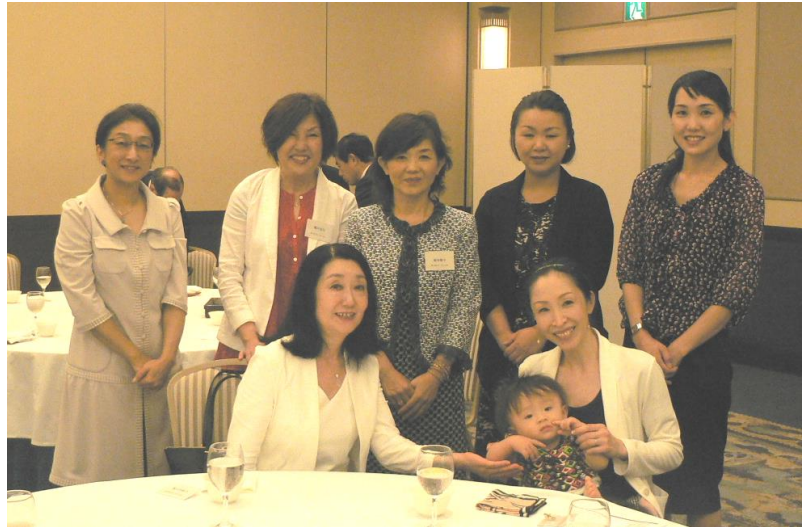
今年度最後の夫人招待日でした。来年度もご支援よろしくお願い致します！

韓国の SBS (民放) が出演者をブッキングしてのコンサートです。約 1 万人の観客で盛り上がったとの報告を受けております。また、その模様はテレビ番組として放送を予定しております。RKK は韓国蔚山 MBC と友好交流を結び、約 8 年前から日韓友情コンサートを一年おきに熊本とウルサンで開催いたしております。竹島問題がありますが、現在も継続して実施しております。今年の日韓友情コンサートは 11/3 熊本学園大の学園祭と連動して「K-POP コン서트」を開催する予定です。