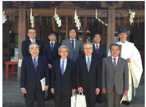
6/3年祝祈願祭 代継宮にて