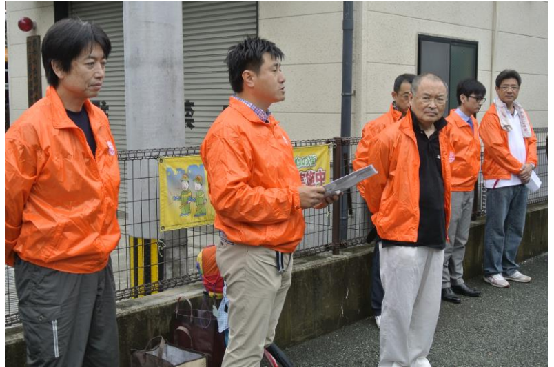
6/2 家族清掃活動に参加の皆さん、大変お疲れさまでした！