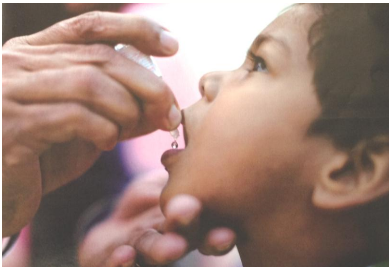
ポリオ撲滅まであと少し。今、私たちにできることはー (ロータリーの友 5月号 P5~17)

国際ロータリー第 2720 地区 熊本南ロータリークラブ Rotary International District 2720 Kumamoto South Rotary Club