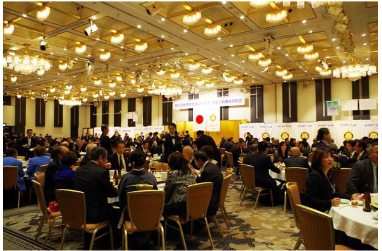
熊本市域新春合同例会@熊本ホテルキャッスル

国際ロータリー第 2720 地区 熊本南ロータリークラブ Rotary International District 2720 Kumamoto South Rotary Club